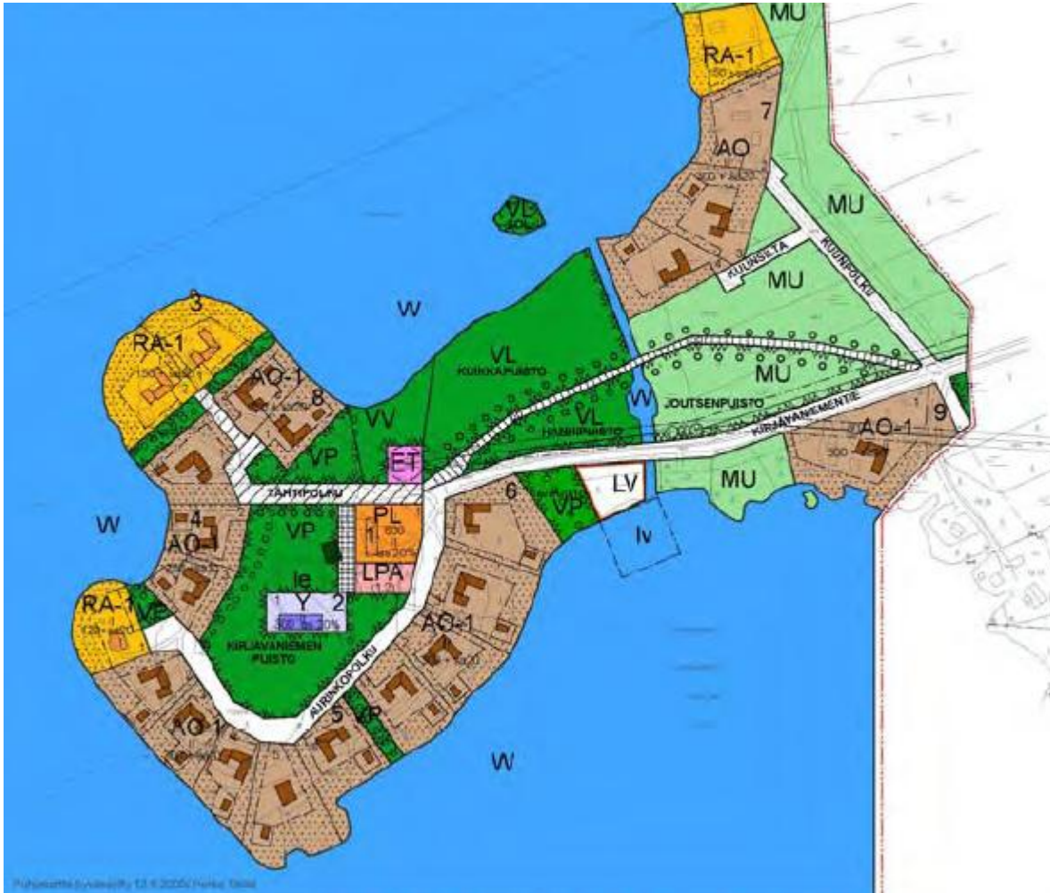
Kuva2. Omarantaisia omakotitalotontteja Kirjavaniemessä