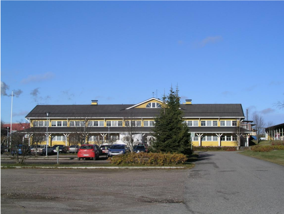
Prt-konsernin toimisto Leiviskänkankaan asemakaava-alueella.