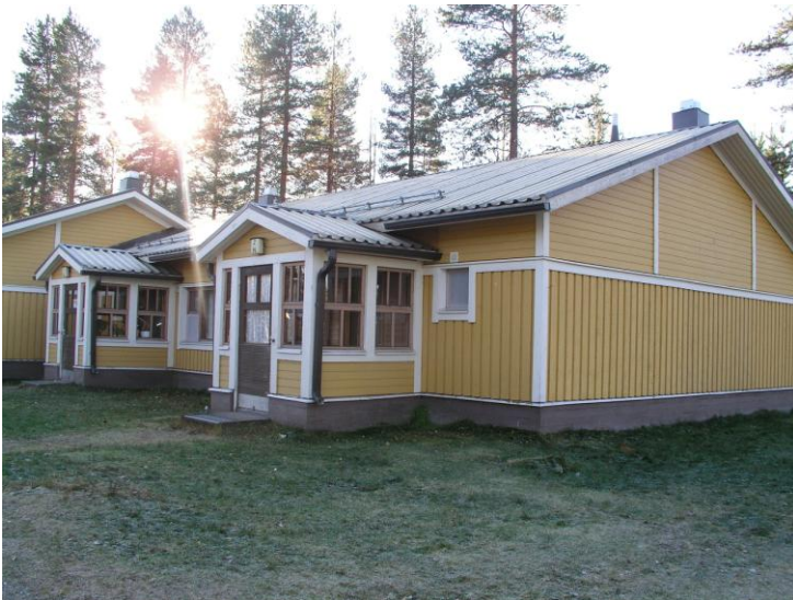
Vuokra-asuntoja Ukonojan asemakaava-alueella.