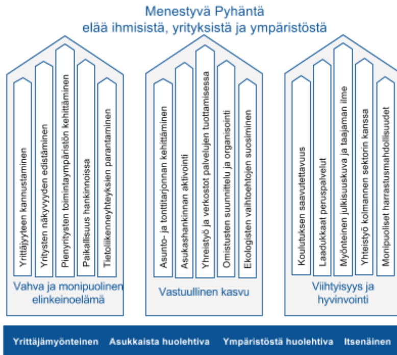
Kuva 2. Strategiset toimenpiteet.