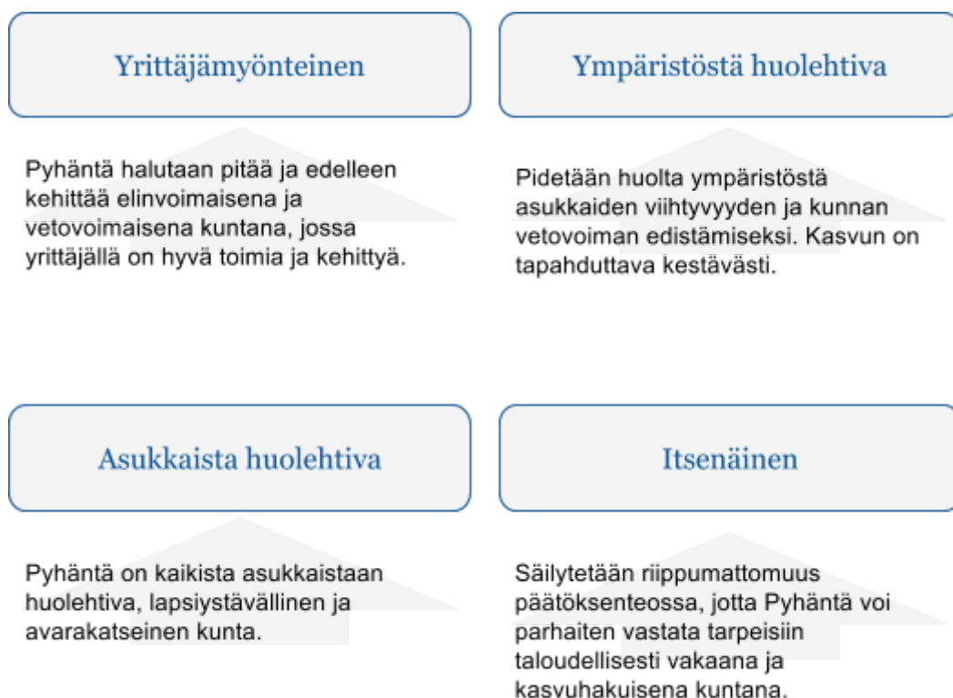
Kuva 1. Pyhännän strategiset arvot.

Pyhännän kunnan strategiaa ja päätöksentekoa ohjaavat kestävät, yhteiset arvot, joiden pohjalta kuntaa kehitetään tasapuolisesti, johdonmukaisesti ja yhteen hiileen puhalttaen. Arvot läpileikkaavat kaikki strategiassa linjatut toimenpiteet. Kuvassa 1 on lueteltu Pyhännän keskeiset arvot.