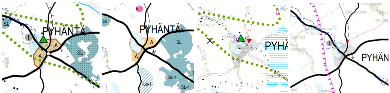
Vas. lukien Pohjois-Pohjanmaan maakuntakaava 2005, 1. 2. ja 3. vaihemaakuntakaava.

Voimassa olevissa maakuntakaavoissa Pyhännän taajamatoimintojen alue (A) rajautuu valtatiehen (Kokkola-/Kajaanintie). Oulu-/Iisalmentie on kantatie. Pohjois-Pohjanmaan maakuntakaavassa Leiviskänkankaan teollisuusalue on seudullisesti merkittävä teollisuusalue (t), joka sijaitsee tärkeällä pohjavesialueella. Pyhännänjärven pohjoispuolitse on osoitettu moottorikelkkailureitti tai -ura, ja Kestiläntien kohdalta pohjoiseen on 2. vaihemaakuntakaavassa osoitettu moottorikelkkailun yhteystarve. 2. vaihemaakuntakaavassa on säilynyt Pyhännänjärven pohjoispuolelle sijoittuva tärkeä virkistys- ja matkailukohteen merkintä ja Leiviskänniemi on osoitettu maakunnallisesti arvokkaaksi rakennetuksi kulttuuriympäristöksi. 3. vaihemaakuntakaavassa on merkinnällä t (Leiviskänkankaalla) osoitettu vähintään seudullista merkitystä omaavia, lähinnä perinteisen teollisuuden tuotanto- ja varastoalueita, jotka eivät sisälly taajamatoimintojen aluevaraukseen ja jotka halutaan turvata muulta maankäytöltä. Punaisella katkoviivamerkinnällä on osoitettu pääsähkijohdon yhteystarve taajaman pohjoisosiin (pitkän aikavälin kehittämistarve). Kirkonkylän itäpuolella näkyy mineraalivaroaluetta vyöhykemerkintä.