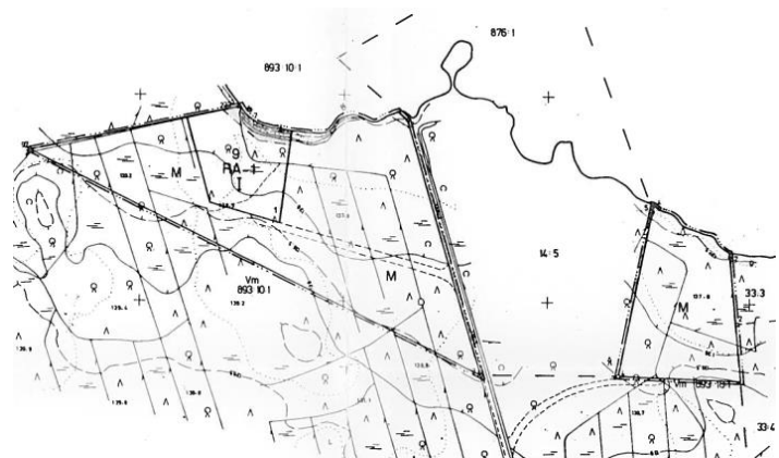
Alueelle laaditut ranta-asemakaavat