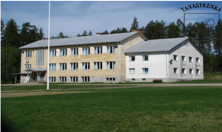
Kuva: Tavastkengän koulu kesällä 2014

Pyhännän kunta myy tarjousten perusteella Tavastkengän koulun kiinteistön. Kiinteistö sijaitsee Pyhännän kunnassa, osoitteessa: Tavastkengäntie 33 A 92910 Tavastkenkä.